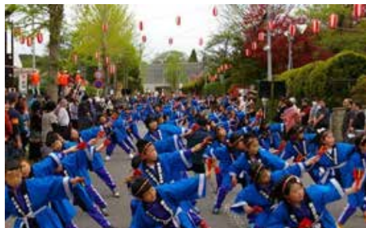
かなやまソーラン (地域祭典での披露) 尾去沢中学校・尾去沢小学校