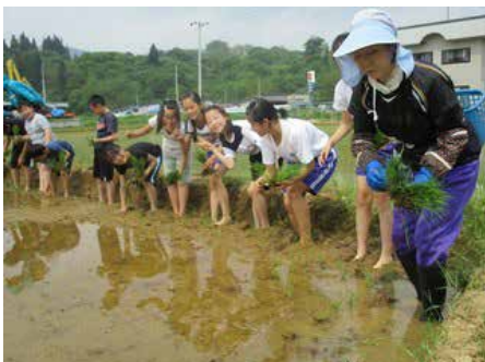
ふれあひかなやまスクール (地域ボランティアによる支援) 尾去沢小学校

わくわく土曜教室（サタちびっ）では、実行委員会が市内の集落営農団体、職業能力開発協会、ヤクルト販売（株）等と協力して、子供たちへの体験活動機会を提供している。