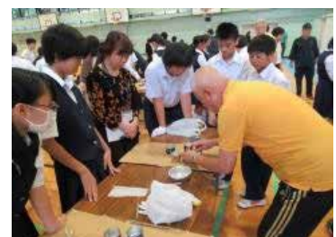
防災授業（ランタン作り）