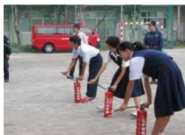
防災授業（消火器訓練）