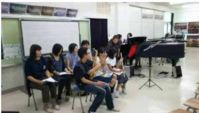
音楽劇「ピーターと狼」