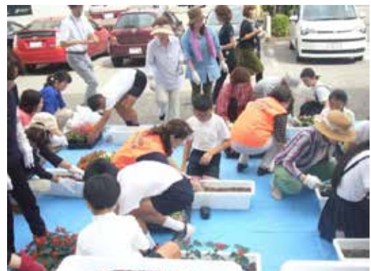
プランターの花苗植え