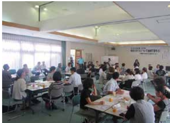
地域ボランティア対象の講演の様子