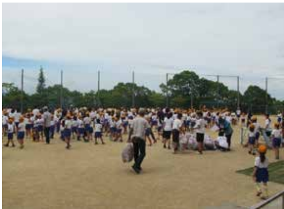
地域一斉清掃の様子

各地域の様々な活動を通じ、子供たちが地域の方とつながるきっかけとなっている。また地域の方が活動に参画することで、自己実現やいきがいがいづくりにつながり、地域の活性化に貢献している。