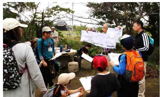
土曜体験活動「水路探検」