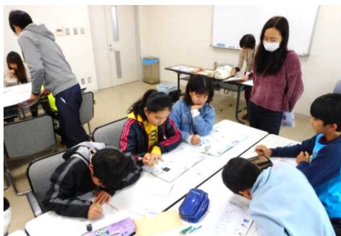
支援するもりの里っ子の自主的な学びを支