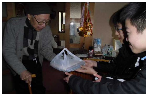
一人暮らしの お年寄り世帯 へおせち料理 を配達する活動