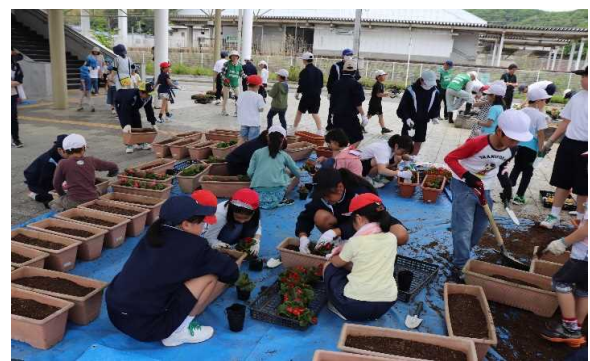
とさ山 一んの 緒や手 緒に地 駅元の のの会 花園・ 植児花 え・水 活小隊 動学皆 の生

○小須戸コミュニティ協議会の企画で、中学1年生が小須戸地域で取材を行い、子どもの視点で「今」の小須戸の現状分析や「未来」の町づくりに関する夢のあるアイデアを町の役場の壁面に投影し、プレゼンテーションを行うなど新しい試みも行っている。