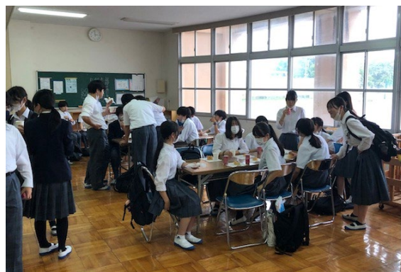
放課後カフェなないろ