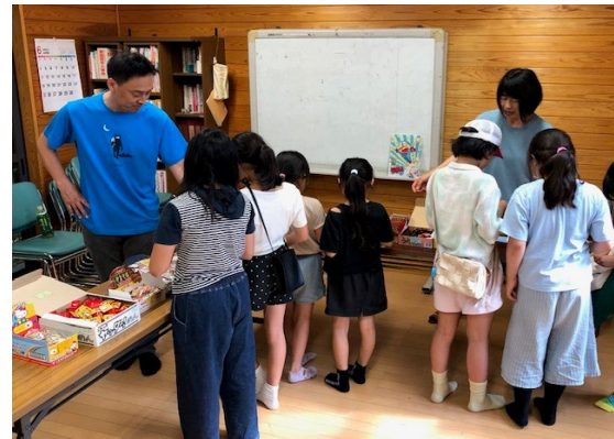
ぬくぬく駄菓子屋

1世帯で転入する家族が多い、第三次産業に従事する保護者が多いことなどから、子どもの体験の幅を広げること、学習支援もただ勉強するだけではなく、ボランティアさんとの交流を深めることを主眼としている。また中学と2小学校の地域学校協働活動推進員が連携し、3校で実施内容のすり合わせ、ボランティアの共有などを行なっている。こどもの居場所「ぬくぬく」は3校合同で運営している。